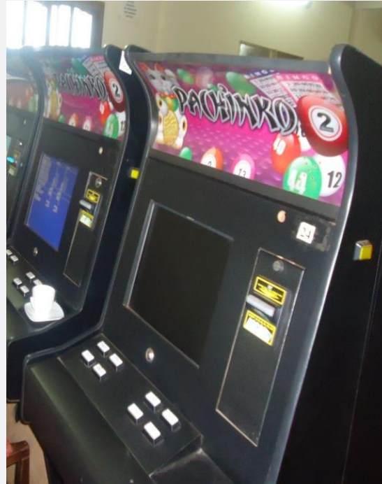
MÁQUINAS DE JUEGO (BILLETERAS)