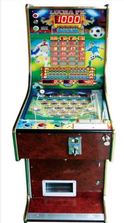
MÁQUINA DE JUEGO PINBAL (MONEDERO)