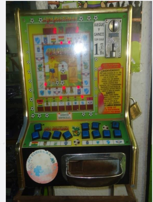
MÁQUINA DE JUEGO (MONEDERO)